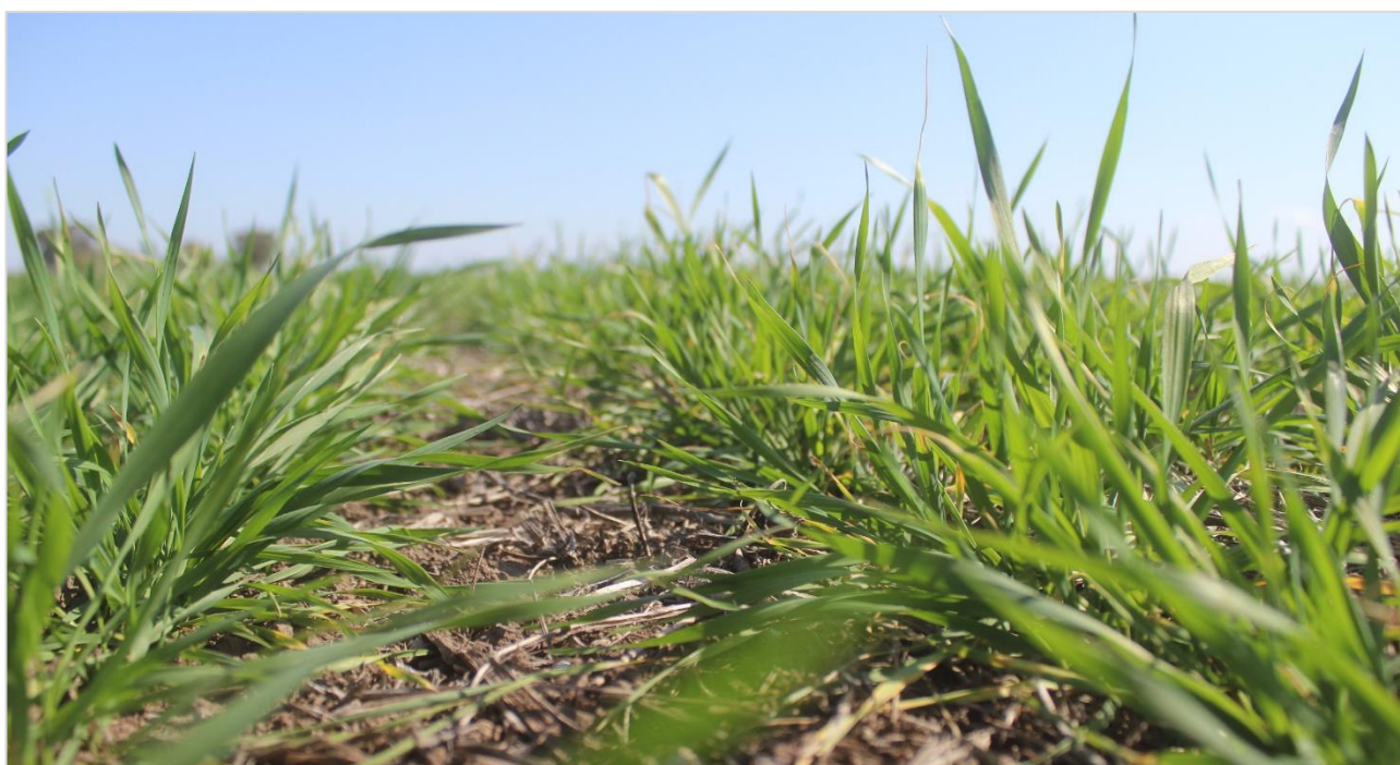
Lote de trigo en macollaje, en buen estado. Carlos Tejedor, Buenos Aires (09-09-20).

Finalmente, al sur del área agrícola nacional, el cultivo presenta lento crecimiento debido a las bajas temperaturas. Si bien mantienen una buena condición de cultivo y no presentan signos de estrés hídrico, necesitan nuevas lluvias para no resignar crecimiento y rinde.